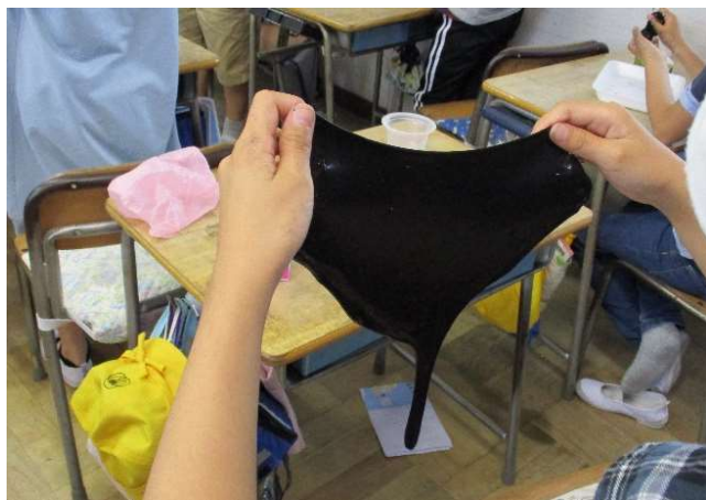
ブラックスライム ～ どこまでのびるかな ～

今月号は、越谷市科学技術体験センター ミラクル MIRACLE から小学校へ行き、授業を行う取り組みの1つ「 小学校3・5年生を対象にした学校利用事業 」についてお知らせいたします。