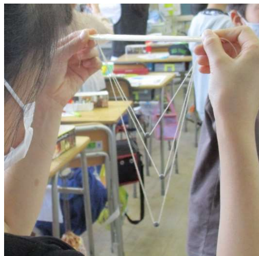
不思議なふりこ ～ うまく動かせるかな ～